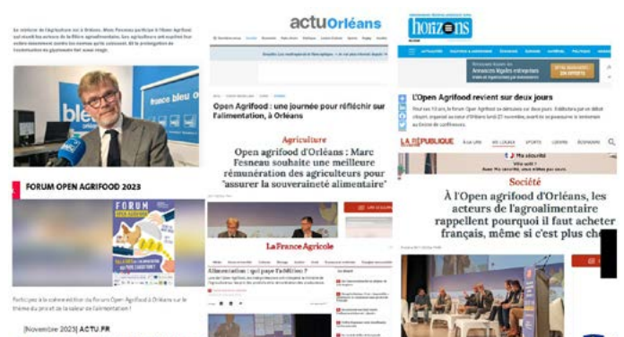
Retombées presse nombreuses à retrouver sur notre site internet : www.openagrifood-orleans.org