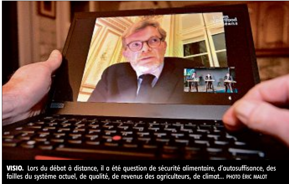
VISIO. Lors du débat à distance, il a été question de sécurité alimentaire, d'autosuffisance, des failles du système actuel, de qualité, de revenus des agriculteurs, de climat...

Une première enquête audiovisuelle s'est dérou-