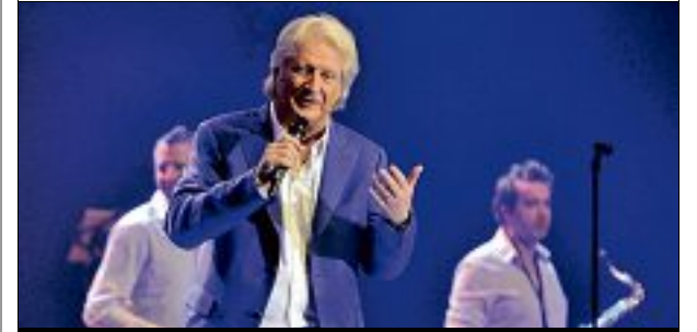
ZÉNITH. Impossible, pour Le Plus Grand Cabaret Du Monde, d'accueillir des artistes venus de pays étrangers.

La tournée du spectacle Le Plus Grand Cabaret Du Monde, programmée en novembre, décembre 2020 et janvier 2021, est reportée. La date de la représentation orléanaise, prévue le 12 décembre prochain, est ainsi reprogrammée au 3 novembre 2021.